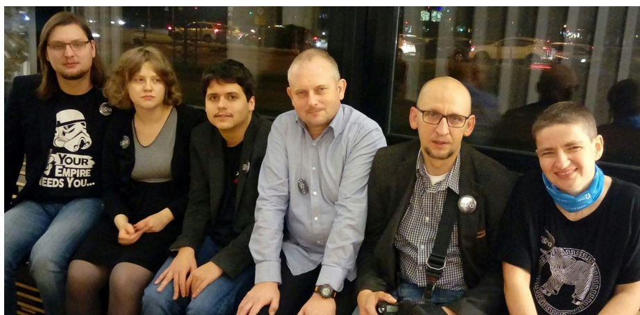
Zespół Spółdzielni Socjalnej FURIA

Naszymi doświadczeniami i rozwiązaniami chętnie dzielimy się ze wszystkimi zainteresowanymi podczas wizyt studyjnych, szkoleń, warsztatów oraz wystąpień na spotkaniach i konferencjach. Nasz model aktywizacji został opisany i opublikowany w formie drukowanej oraz jest dostępny w formie e-broszury. Pracownik Spółdzielni odwiedzają przedstawiciele organizacji pozarządowych, instytucji i placówek reintegracyjnych. Doskonale rozumiemy potrzebę poznawania dobrych praktyk, ale zdajemy sobie również sprawę i podkreślamy zdecydowanie, że tworząc przestrzeń pracy dla osób z niepełnosprawnościami specjalnymi, zawsze należy być pionierem, odkrywcą – ponieważ to, co jest dla każdego, jest do niczego – kopiowanie rozwiązań bez dopasowania ich do potrzeb i możliwości konkretnych ludzi staje się przepisem na nieuchronną porażkę. Przyjęcie do zespołu nowego pracownika czy goszczenie stażysty powoduje, że proces adaptacji w środowisku pracy każdorazowo rozpoczyna się od podstaw i realizuje przesłanie: poznanie – zrozumienie – akceptacja, by możliwa była wspólna praca.