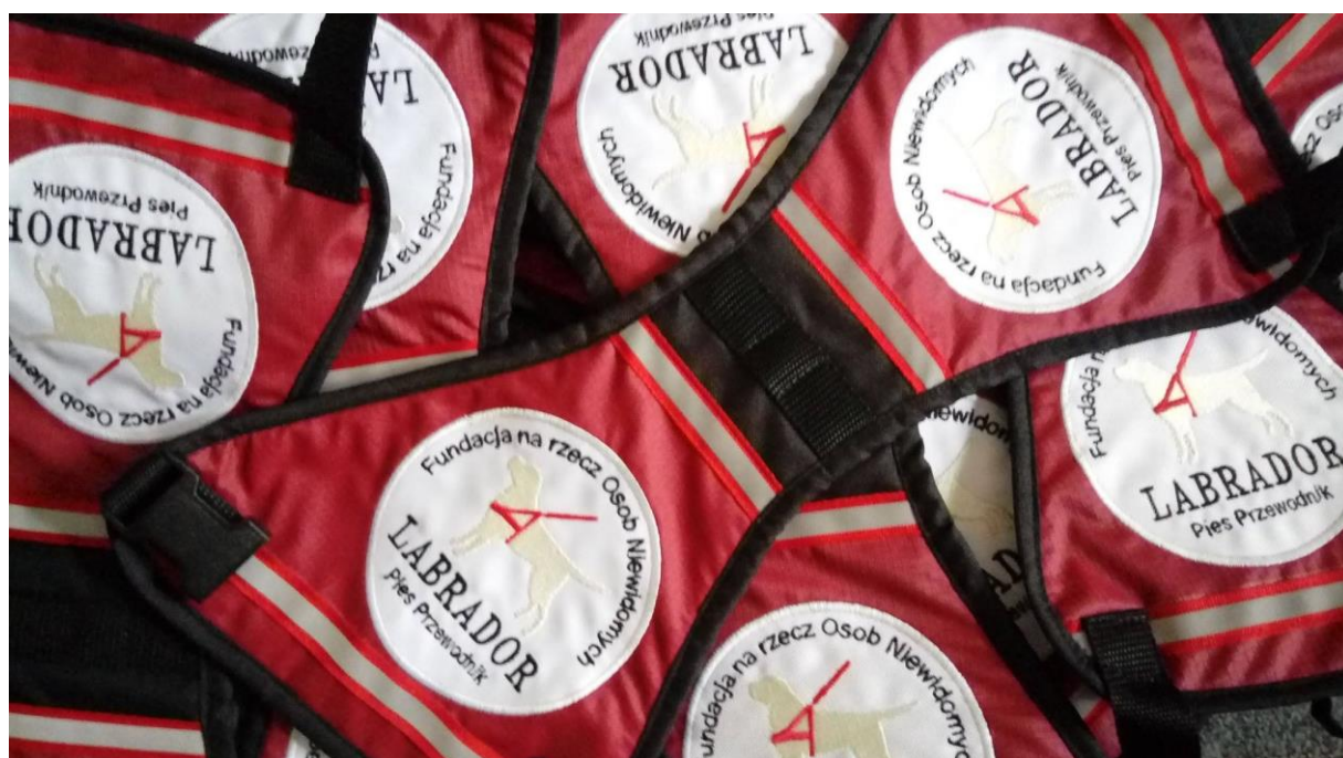
Kamizelki dla psów pracujących wykonane dla Fundacji LABRADOR

Współpracujemy również ze stałymi biznesowymi partnerami, realizując wspólne projekty lub tworząc produkty na ich zamówienie. Na przykład BANERKA jest projektem, który łączy duch upcyklingu z ideą odpowiedzialnego społecznie biznesu oraz celem charytatywnej inicjatywy (część zysku z każdej sprzedanej sztuki dedykowany jest aktywizacji zawodowej osób w spektrum autyzmu). To torba zaprojektowana dla Volvo Firma Karlik, wykonana jest z niepotrzebnych, zużytych już banerów reklamowych oraz odzyskiwanych pasów bezpieczeństwa.