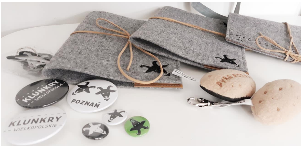
Klunkry Wielkopolskie – okładki, magnesy i breloki

Jesteśmy również częścią grupy Klunkry Wielkopolskie, która od kilku już lat łączy przedstawiciele instytucji działających w obszarze ekonomii społecznej, zdeterminowanych, by inwestować w pomoc ludziom doświadczającym zróżnicowanych trudności. Markę, pod skrzydłami Regionalnego Ośrodka Polityki Społecznej w Poznaniu, tworzą wielkopolskie przedsiębiorstwa i organizacje (ZAZ w Pile, Manufaktura Dobrych Usług, Centrum Integracji Społecznej Darzybór, Taka Mydlarnia i WTZ Krzemień z Poznania) zatrudniające osoby z pełnosprawnościami, z zaburzeniami psychicznymi oraz wychodzące z bezdomności.