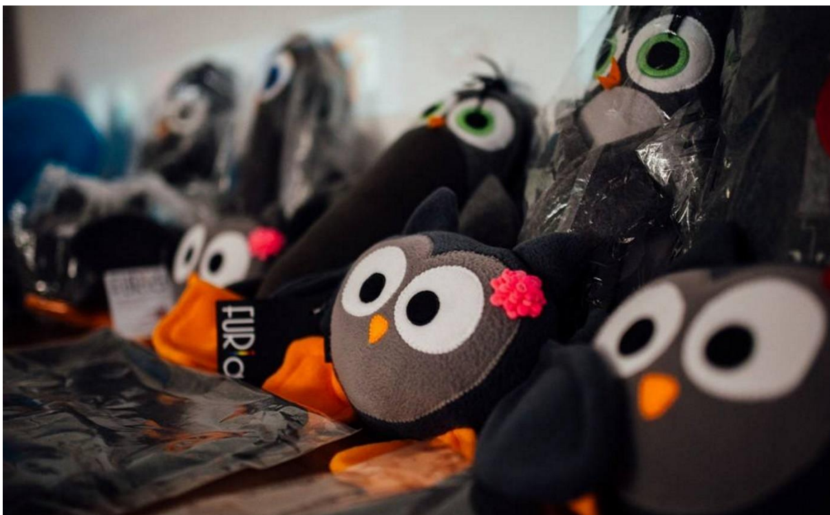
Sowy i inne przytulaszki

Przyczyny takiej sytuacji nie są trudne do zdiagnozowania – wysokie standardy dotyczące zarówno warunków pracy, jak i jakości ofertowych produktów i usług nie do końca wpisują się w potrzeby rynku. Nie jesteśmy w stanie konkurować ani z wielkimi szwalniami produkującymi tanio, ani z ekskluzywnymi markami sprzedającymi drogo. Powszechne odpowiedzialne społecznie wybory konsumentów to jeszcze pieśń przyszłości. Sukcesem można jednak nazwać niewątpliwie drogę, jaką przeszliśmy z naszym zespołem. Te wszystkie codzienne doświadczenia i konsekwentnie niwelowane bariery. Sukcesem jest to wszystko, co nas łączy... czyli FURIA – rozumiana już teraz jako ukierunkowana pasja do działania, rozwijania nas samych oraz naszego wspólnego przedsiębiorstwa.