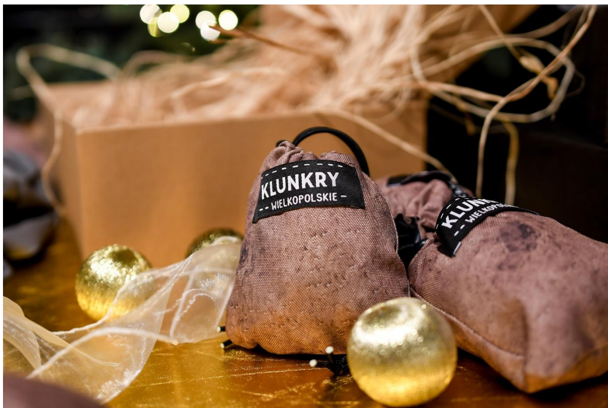
Klunkry Wielkopolskie – torba PYRA

W naszych pracowniach powstaje rodzina profesjonalnie zaprojektowanych produktów, będących propozycją dla klientów poszukujących praktycznych i wysokiej jakości upominków z Wielkopolski. FURIA szyje dla marki torby PYRY, wykonuje breloki i magnesy z PYRAMI i KOZIOŁKAMI oraz haftowane filcowe okładki na zeszyty i książki. Jesteśmy dumni, że dystrybucja „klunkrów” za pośrednictwem sklepu internetowego została powierzona naszej spółdzielni. Pakowanie i nadawanie przesyłek to zadania, które nie tylko pozwalają uzupełnić budżet przedsiębiorstwa, ale – co nie mniej ważne – dają okazję do społecznej rehabilitacji i nabywania nowych kompetencji przez naszych pracowników z autyzmem.