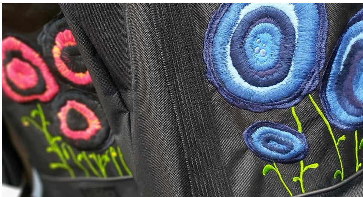
Ręcznie haftowane aplikacje kwiatowe na FURIATKACH

Dla marki UPNAP szyjemy kolorowe hamaki oraz inne produkty turystyczne – łączy nas potrzeba biznesowa, ale bardzo ważnym elementem tej współpracy są wspólne wartości oraz wspinaczkowa pasja. Natomiast wykonywane u nas przypinki/buty/piny dla marki ASPIRACJE to małe, dekoracyjne i inspirujące realizacje, które pozwalają osobom w spektrum autyzmu opowiedzieć o sobie, stają się magicznymi nośnikami przekazu o potencjale tworzących je osób. Wśród naszych długoletnich partnerów jest również marka Szududu, dla której szyjemy stylowe kosmetyczki i torby dla aktywnych kobiet. Od 2018 roku Spółdzielnia FURIA realizuje również swój wymarzony projekt autorski: FURIATKA – to praktyczna torba w kilku designerskich odsłonach: „klasyczna” – czarna z kolorowymi podszewkami, „rozważna” – obszywana odblaskiem oraz „romantyczna” – dekorowana ręcznie haftowanymi aplikacjami kwiatowymi.