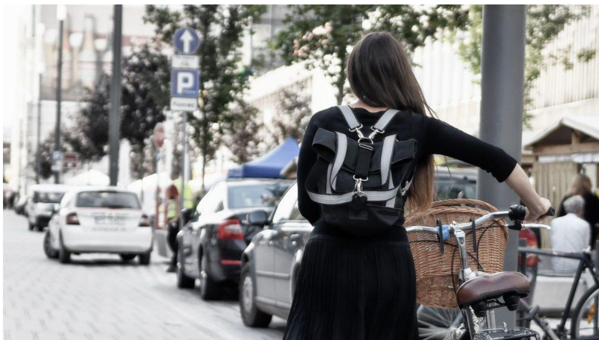
Smartka – odblaskowy plecak testowany przez poznańskie rowerzystki

Dziś w Spółdzielni Socjalnej FURIA pracuje siedmioro pracowników. Różni nas prawie wszystko: wiek, poziom szeroko rozumianej sprawności, ścieżka edukacyjna i ostateczne wykształcenie. Pięcioro członków naszego zespołu to osoby w spektrum autyzmu – wszyscy są z nami od początku i deklarują kontynuację zatrudnienia – czworo to osoby z orzeczoną znacznym lub umiarkowanym stopniem niepełnosprawności. Mamy różne talenty, zainteresowania i pasje, które są wprost wykorzystywane w codziennej pracy i zawsze uwzględniane przy podziale konkretnych obowiązków w ramach danego zlecenia. Razem tworzymy społeczność, która wspiera się w różnych przestrzeniach życia – znamy swoje rodziny, możemy na siebie liczyć nie tylko w pracy, również w innych codziennych wyzwaniach. Pracujemy według zindywidualizowanej siatki godzin pracy, w przestrzeniach uwzględniających nasze organizacyjne, sensoryczne i estetyczne zróżnicowane potrzeby. W ramach podejmowanych zleceń dzielimy się obowiązkami tak, by realizowane zadania przynosiły satysfakcję oraz dawały szansę na dalszy rozwój naszych umiejętności i kompetencji.