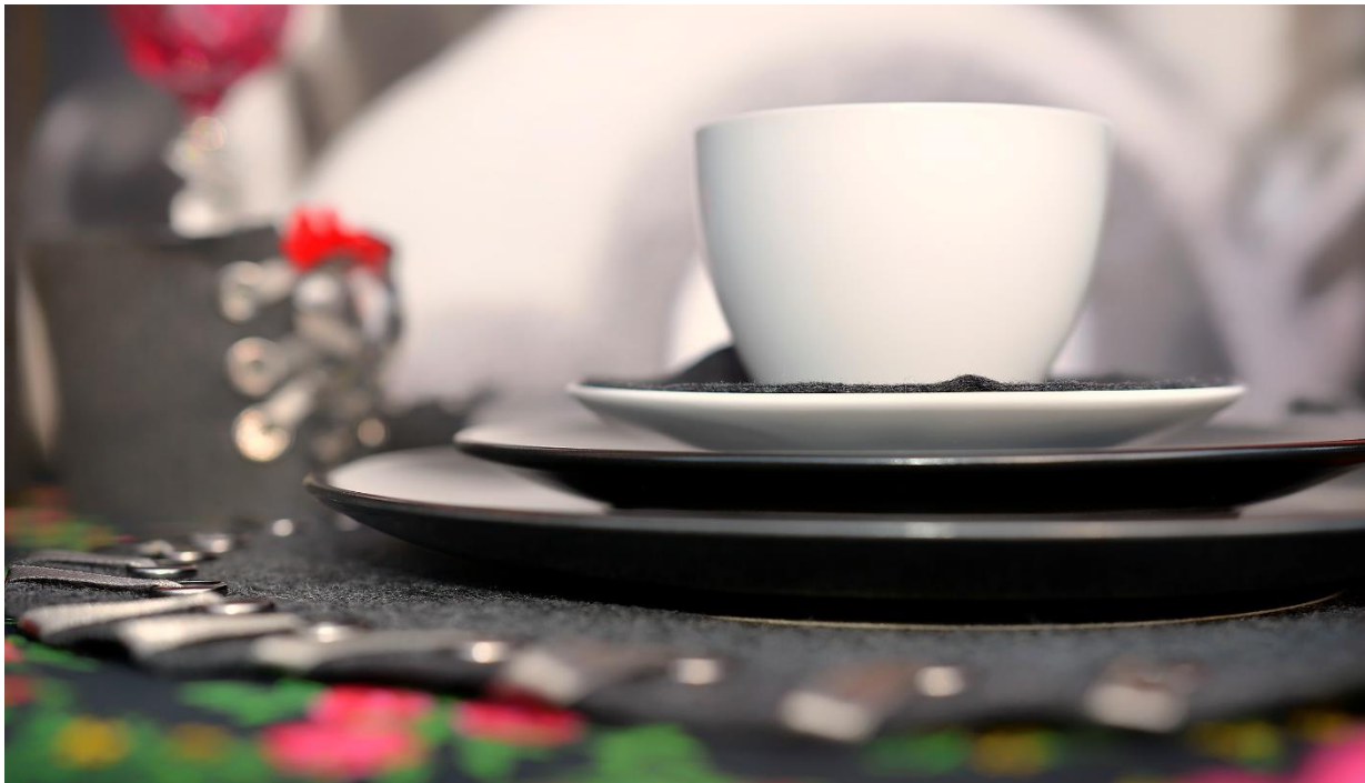
Filcowa dekoracja stołu – Dzień ES w Fundacji Pomocy Wzajemnej BARKA

Jesteśmy również częścią grupy Klunkry Wielkopolskie, która od kilku już lat łączy przedstawiciele instytucji działających w obszarze ekonomii społecznej, zdeterminowanych, by inwestować w pomoc ludziom doświadczającym zróżnicowanych trudności. Markę, pod skrzydłami Regionalnego Ośrodka Polityki Społecznej w Poznaniu, tworzą wielkopolskie przedsiębiorstwa i organizacje (ZAZ w Pile, Manufaktura Dobrych Usług, Centrum Integracji Społecznej Darzybór, Taka Mydlarnia i WTZ Krzemień z Poznania) zatrudniające osoby z pełnosprawnościami, z zaburzeniami psychicznymi oraz wychodzące z bezdomności.