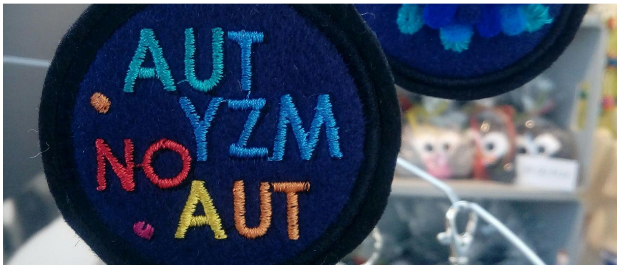
Brelok z haftowanym mottem Fundacji FIONA

Odpowiedź nasuwała się sama: należy gruntownie zbadać problem – nie teoretycznie, lecz empirycznie – i zastanowić się nad remedium. Należy stworzyć miejsca pracy wykorzystujące indywidualne zasoby, talenty tej grupy pracowników oraz zmienić perspektywę, kierując uwagę nie na niepełnosprawność, lecz na skuteczne likwidowanie barier w środowisku pracy.