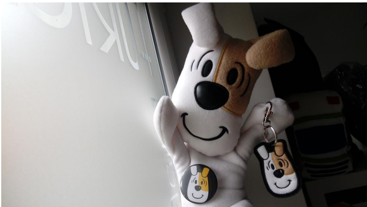
Zestaw gadżetów na 50. rodziny Reksia

Współpracujemy również ze stałymi biznesowymi partnerami, realizując wspólne projekty lub tworząc produkty na ich zamówienie. Na przykład BANERKA jest projektem, który łączy duch upcyklingu z ideą odpowiedzialnego społecznie biznesu oraz celem charytatywnej inicjatywy (część zysku z każdej sprzedanej sztuki dedykowany jest aktywizacji zawodowej osób w spektrum autyzmu). To torba zaprojektowana dla Volvo Firma Karlik, wykonana jest z niepotrzebnych, zużytych już banerów reklamowych oraz odzyskiwanych pasów bezpieczeństwa.