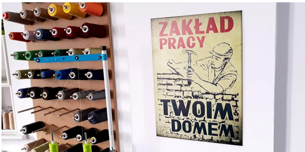
Poznańska pracownia Spółdzielni Socjalnej FURIA

W tamtych latach wielokrotnie zadawaliśmy sobie pytania: dlaczego tak się dzieje? Dlaczego wśród uczestników naszych zajęć dostrzegamy weteranów aktywizacji zawodowej – osoby, które z „sukcesem” ukończyły dwa lub trzy takie projekty i deklarowały chęć udziału w kolejnych? Projekty – taka zabawa w pracę – zaczynały się, trwały i kończyły, jednak ich finałem nigdy nie była prawdziwa praca, nie był nawet staż... a z czasem zacierało się nawet oczekiwanie przyszłego zatrudnienia u wszystkich aktorów tej projektowej przygody. Co stało na przeszkodzie? Wiarygodna z punktu widzenia naszych doświadczeń – jako terapeutów i rodziców – wydawała się jedynie argumentacja najbardziej praktyczna i przyziemna, czyli ekonomiczna.