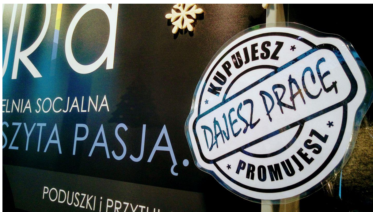
Spółdzielnia podszyta pasją

Za nami już sześć lat działalności Spółdzielni, blisko półtora tysiąca dni i wielokrotnie więcej godzin radości, smutków, zmagañ i doświadczeń, które pozwoliły nam znaleźć się bliżej odpowiedzi na kluczowe pytania: jak stworzyć warunki dla skutecznej aktywizacji zawodowej osób z autyzmem? Jak znaleźć balans i optymalnie połączyć potrzeby oraz możliwości naszych pracowników z potrzebami i marzeniami naszych klientów? Dziś FURIA to fuzja talentów, feeria pomysłów i pasja w działaniu, jednak pierwotną motywacją do powstania przedsiębiorstwa była inna furia – przede wszystkim złość i niezgoda na brak rozwiązań skutecznie wspierających zawodową aktywizację osób w spektrum autyzmu oraz brak „przestrzeni” dla ich efektywnego, trwałego zatrudnienia i wykorzystania w pracy wyjątkowego potencjału autystycznego pracownika.